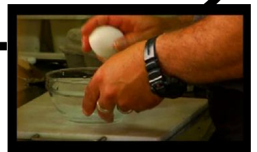
כוכבות אורחות: ביצים (מטאפורה להבדל שבין גברים ונשים)