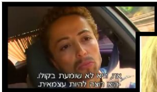
אתה היא לא שומעת בקול היא חצה להיות עצמאית

הסדרה משודרת מחר (שבת) ב-23:05 ניתן לצפות בפרקים שכבר שודרו באתר נענע 10.