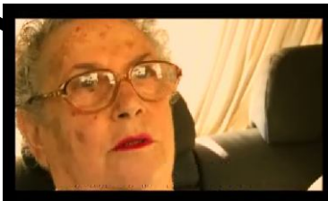
כוכבת אורחת: בולשיט.