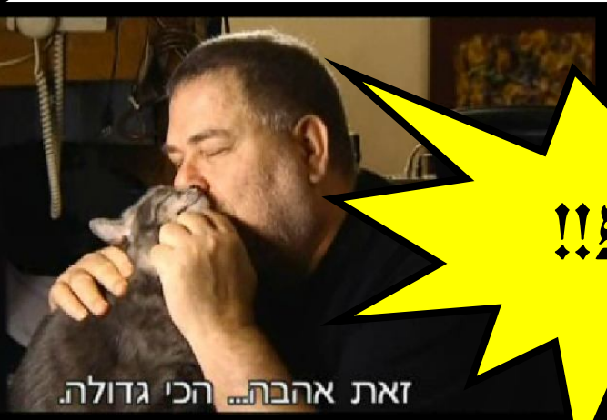
זאת אהבת... הכי גדולה.