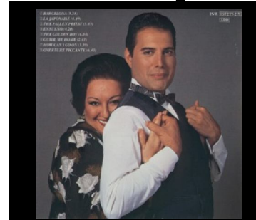
גלוח שפם, עם מונסראט קאבאייה