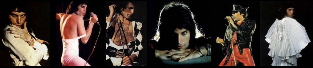
שנות השבעים הסוערות

פרדי מרקורי מת ב-24 בנובמבר 1991. ההודעה הרשמית על מחלתו יצאה 24 שעות בלבד טרם מותו. בהצהרה אותה ניסח בעצמו כתב: "הגיע העת שמעריצי וחבריי ידעו את האמת". למחרת, עשר דקות לאחר שהאישה בחייו, מארי אוסטין עזבה את החדר וכשמאהבו, ג'ים הוטון, לצידו, מת פרדי מרקורי.