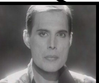
1991-these were the days of our life