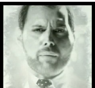
1989 – I want it all