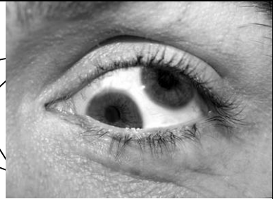
"Double eye", Olafur Eliasson, Berlin, Summer 2004

זיג הגיגים על קולנוע, טלוויזיה ושאר ירקות לכ"ר גיליון 1, יום חמישי 27 אוגוסט 2009